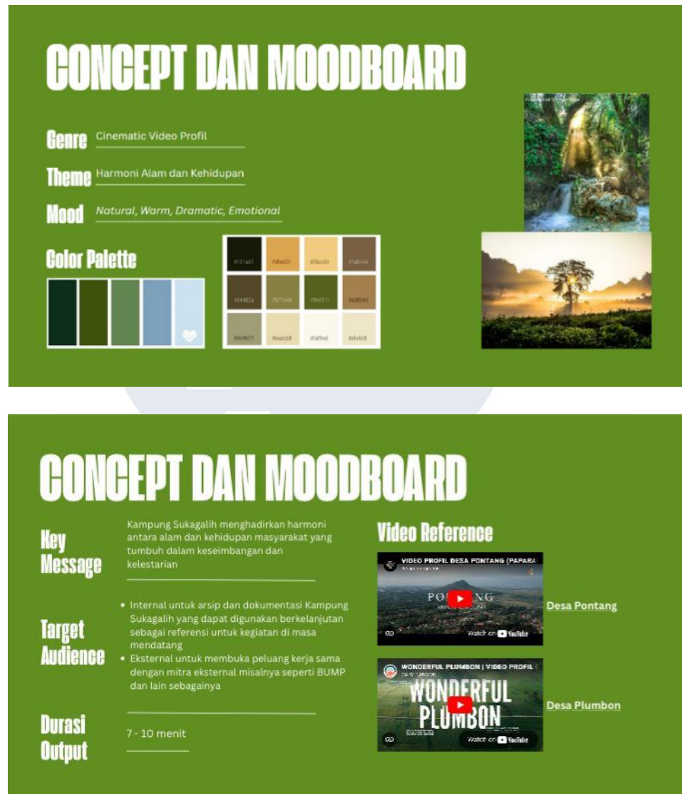
Gambar 3. 2 Konsep Perancangan Video Profil Kampung Sukagalih

visual yang natural dan warm untuk menonjolkan suasana pedesaan. Hasil dari tahap ini berupa dokumen pra-konsep, catatan ide visual, dan moodboard yang menjadi panduan bagi seluruh proses selanjutnya.